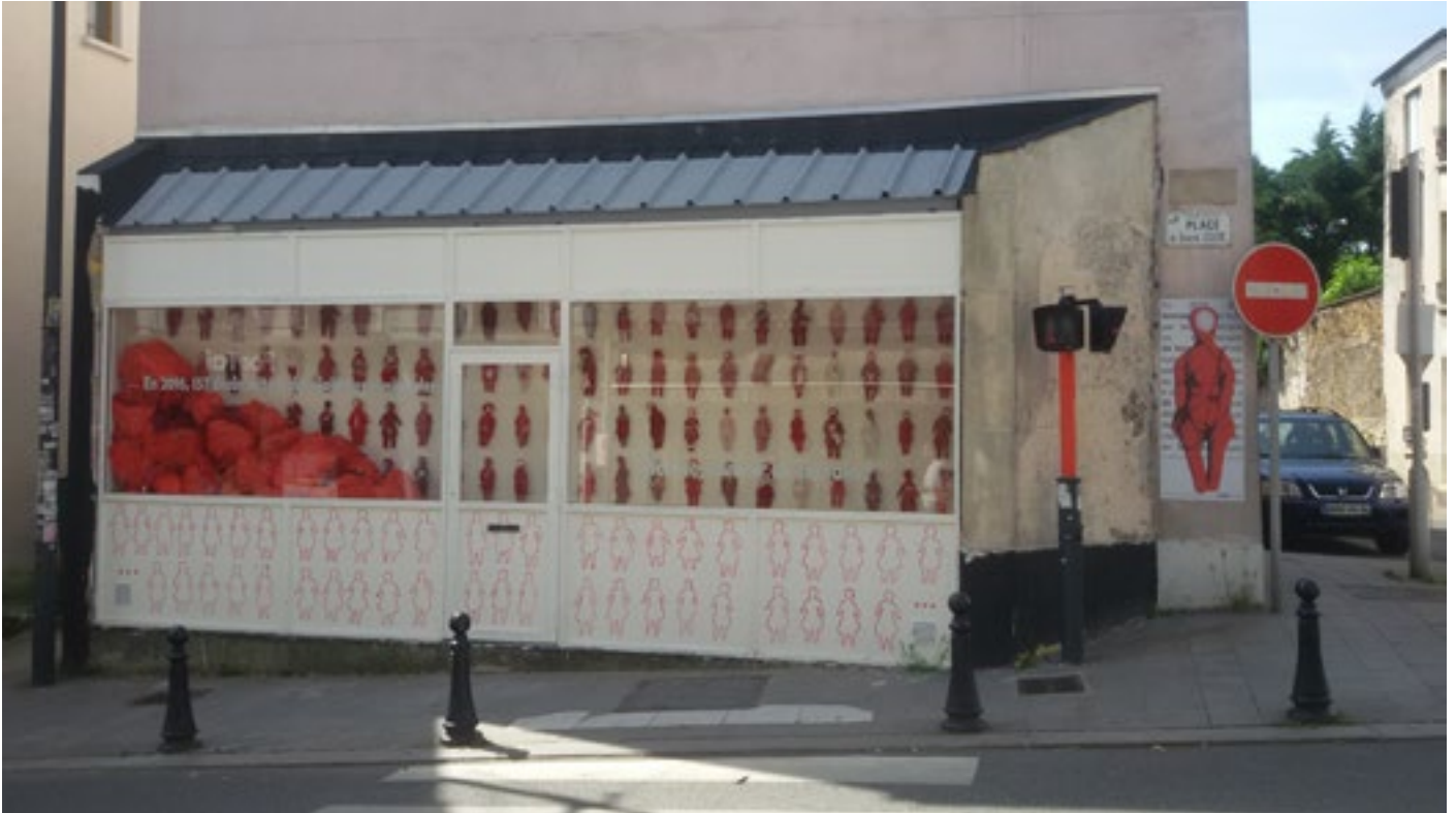
Installation DOLORES à La Galeru, Fontenay-sous-Bois, 2018