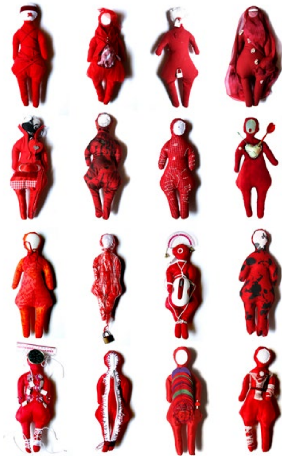
DOLORES Créations textiles Installation