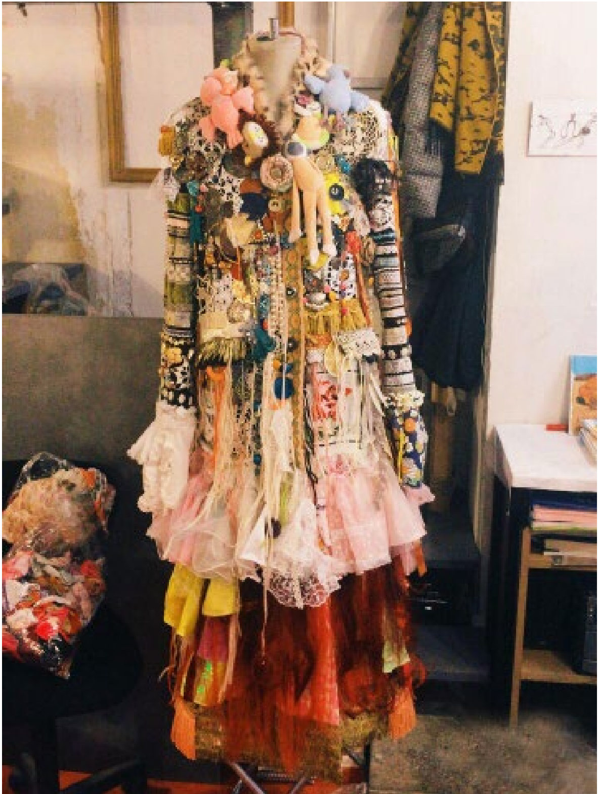
Ton Autre Matériaux récupérés auprès de La Petite Rockette, Paris Bijoux, perruques, vêtements barbie, peluches Série habits-habitats 2016