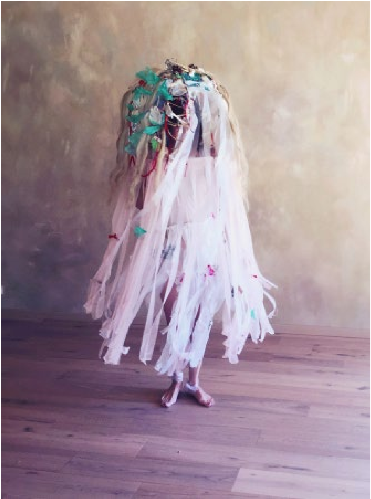
Comme un ange qui pleure Fils électriques, osiers, nylon, bouts de plâtres Série habits-habitats 2016