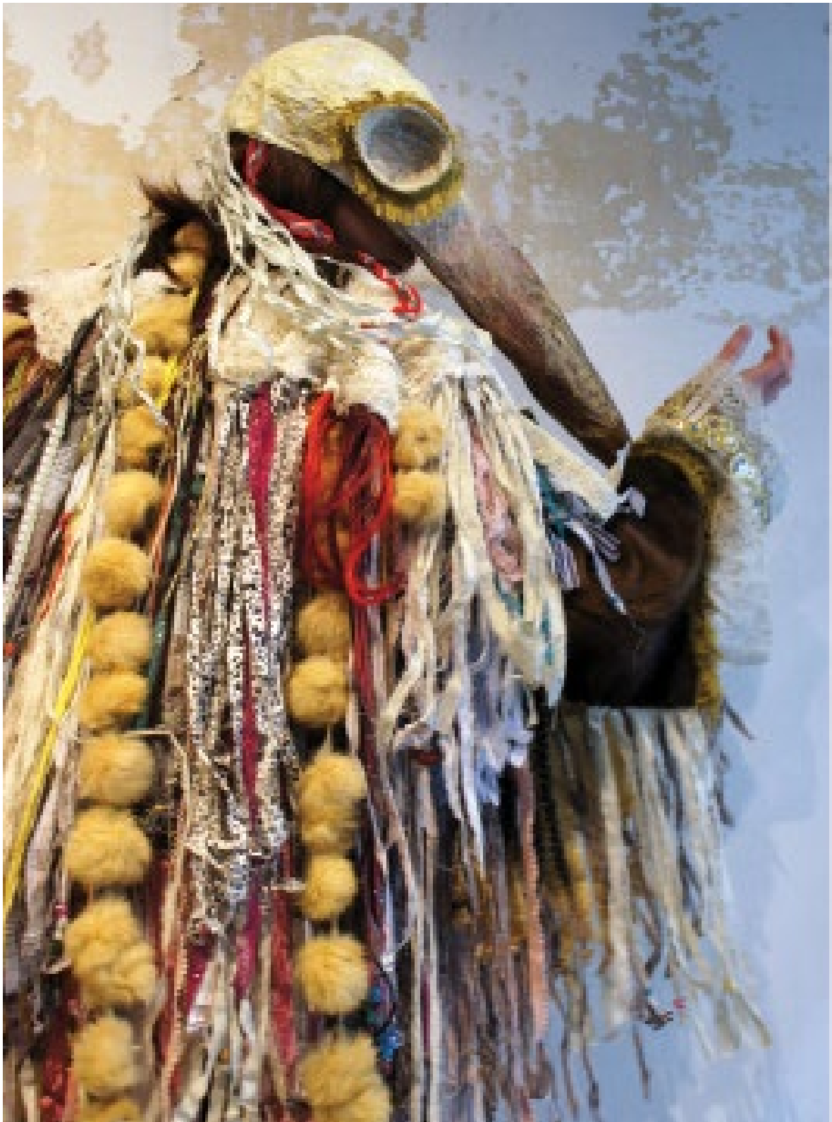
TIPIPLUI Fourrure, bandelettes de chemises, perles Série habits-habitats 2017