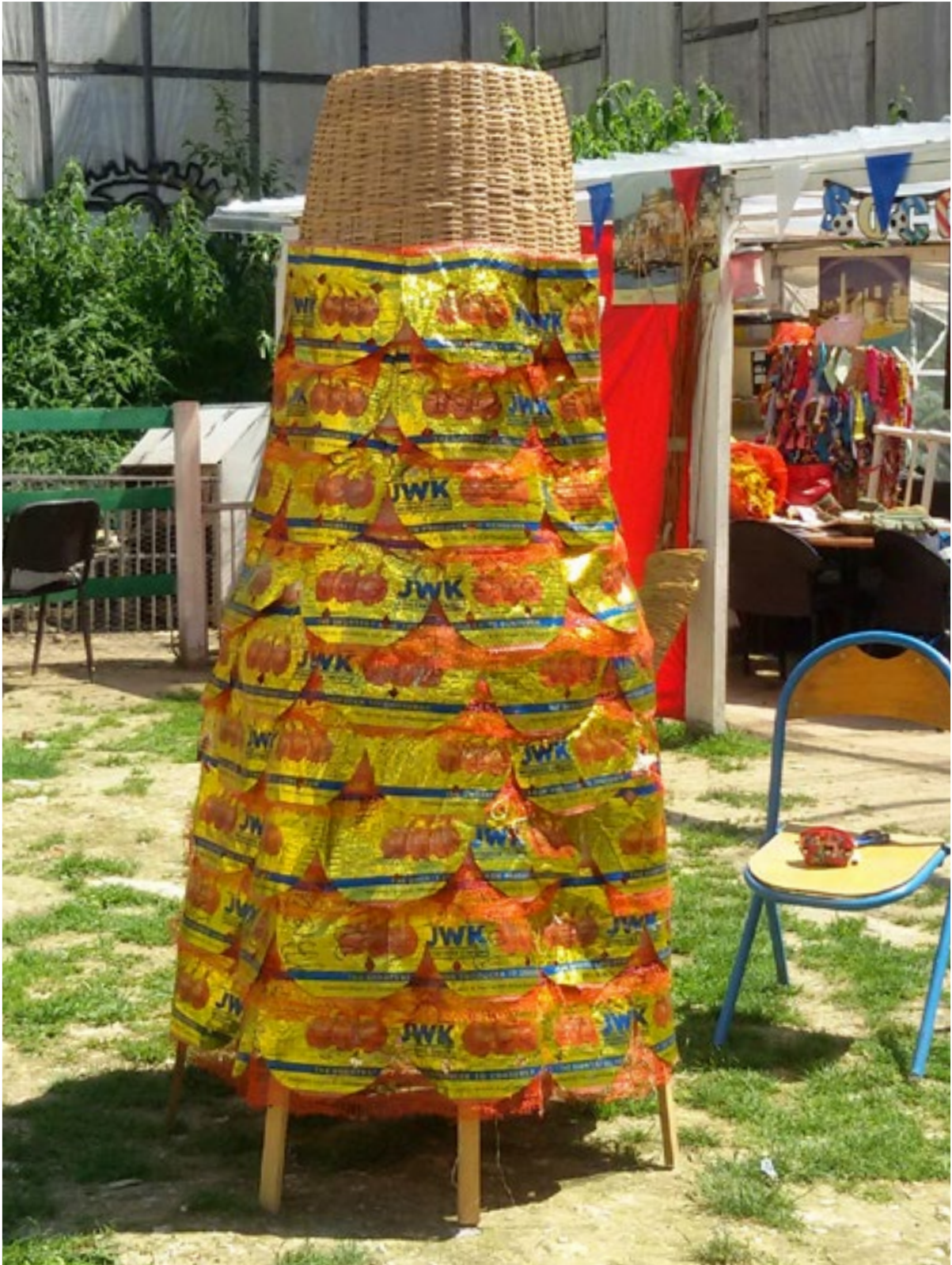
ANTRE à écailles d'or Sacs de riz et filets d'oignons Série habits-habitats 2018