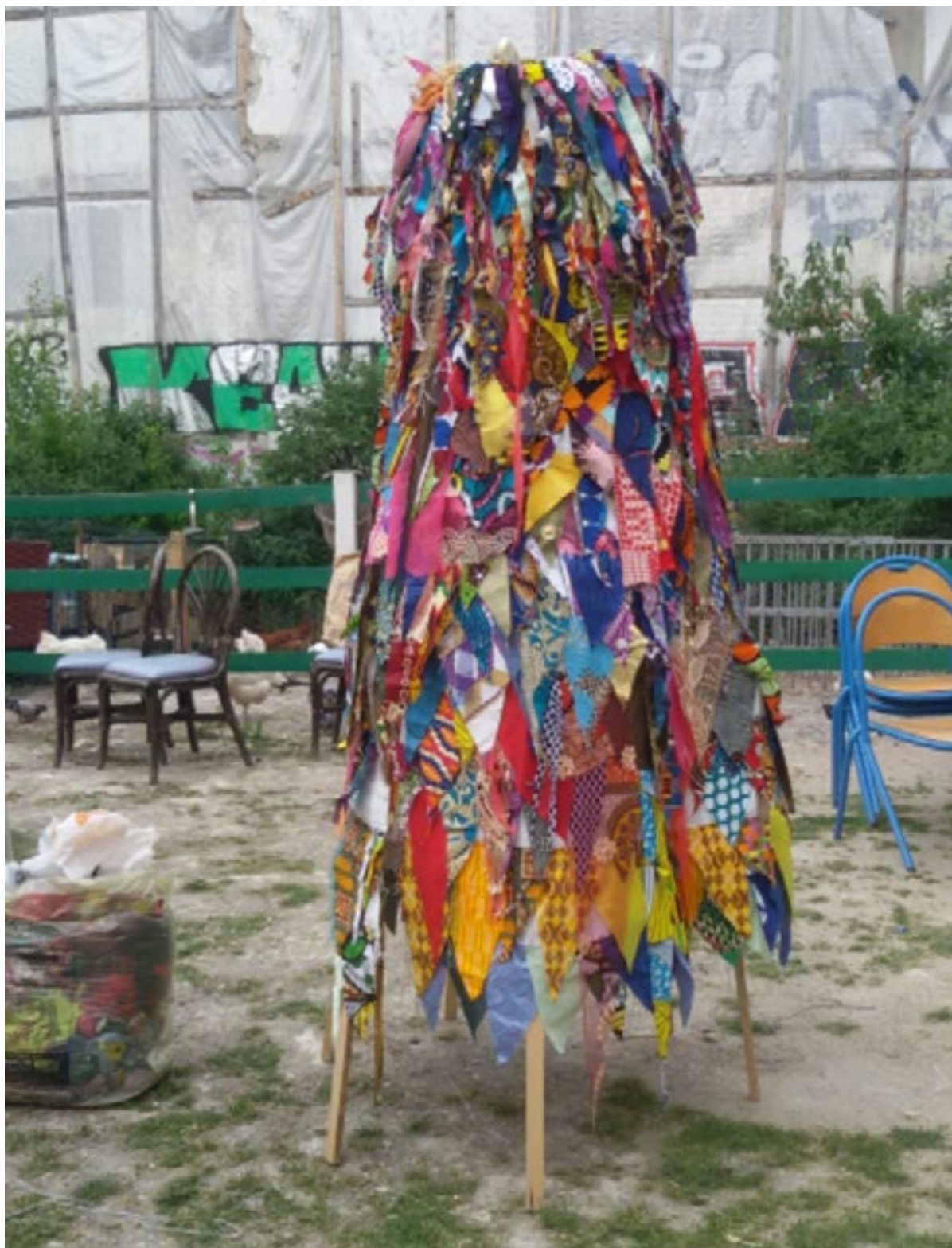
ANTRE Sacs de riz et chutes de tissus wax Série habits-habitats 2018